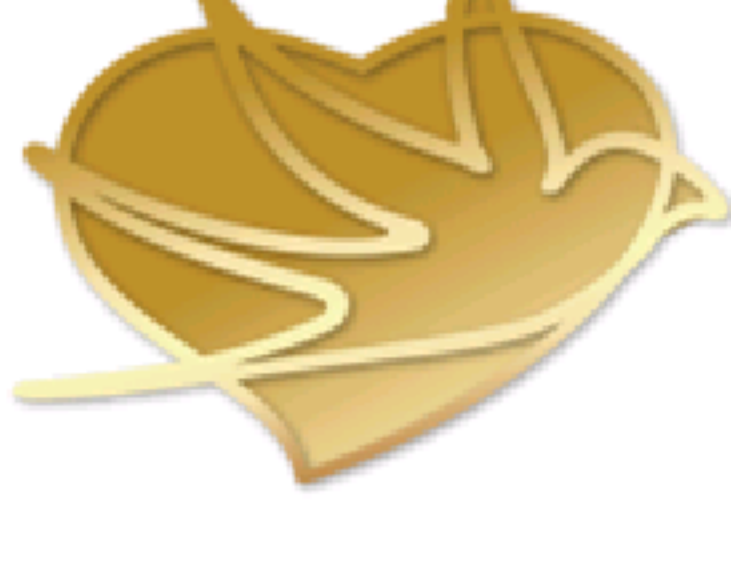
东航“凌燕”乘务示范组LOGO